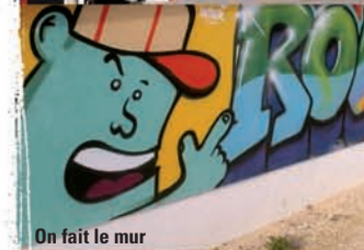
On fait le mur